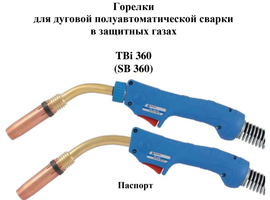
Горелки для дуговой полуавтоматической сварки в защитных газах